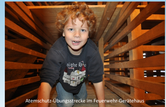
Atemschutz-Übungsstrecke im Feuerwehr-Gerätehaus